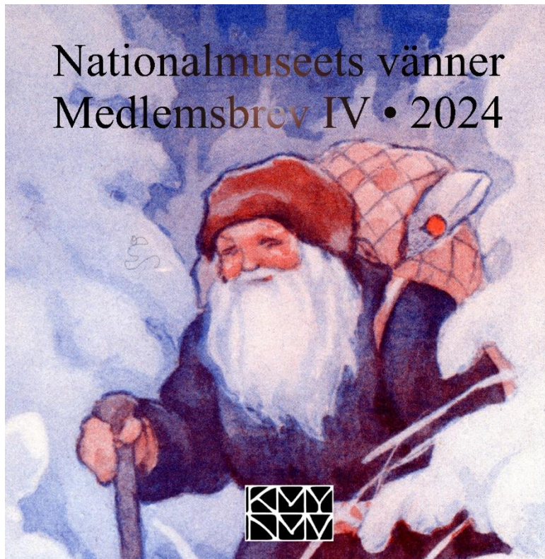
Rudolf Koivu (1890–1946), "Julbocken kommer med sina gåvor" (1937).