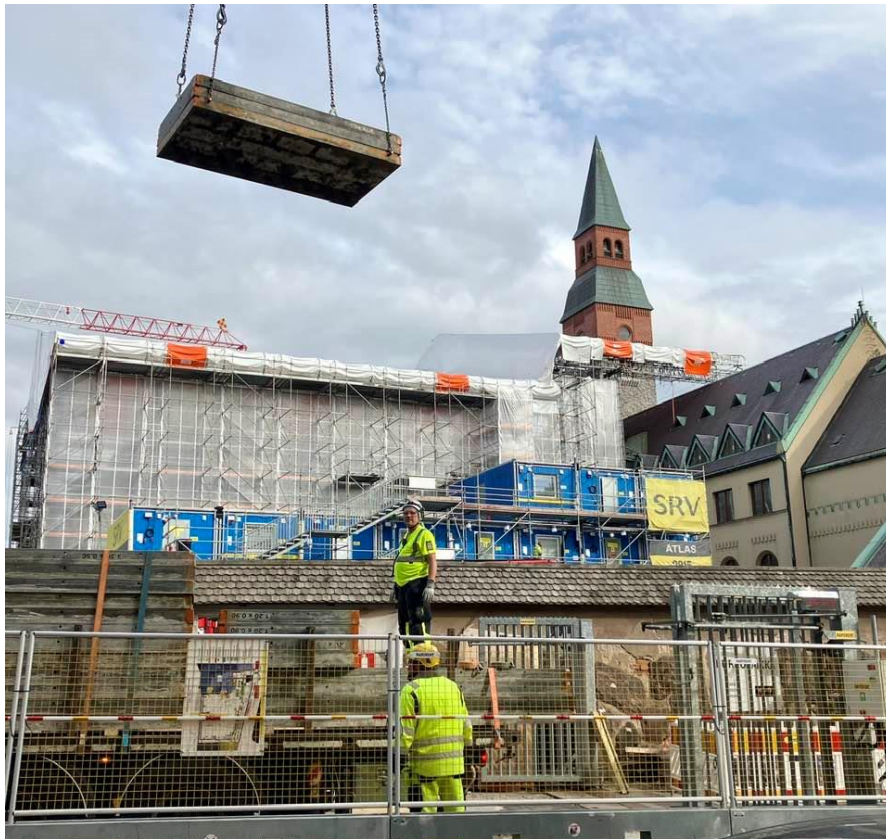
Bild 2 – Annexprojektets byggnadsplats, med Nationalmuseets huvudbyggnad i bakgrunden. På bilden ses även tungkapacitetslyftkranen i bruk.