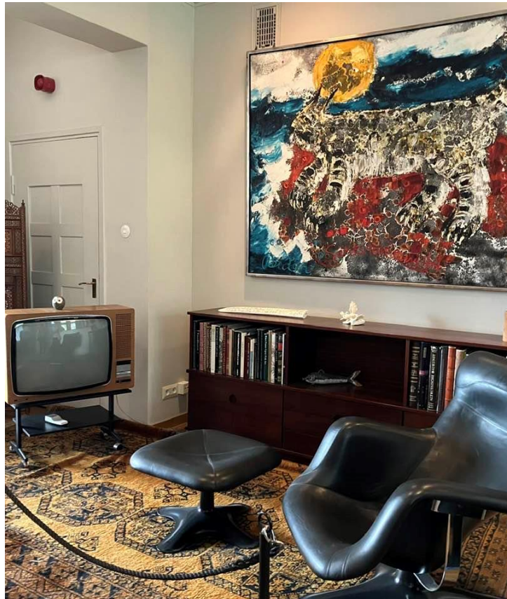
Bild 1 – Ville Nikunen och några Vänner kring president Kekkonens skrivbord.